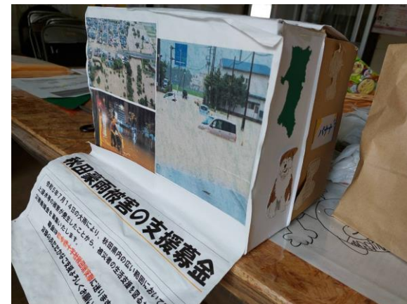
▲学生VC (岩手県立大)、結 (盛岡大) での合同募金活動