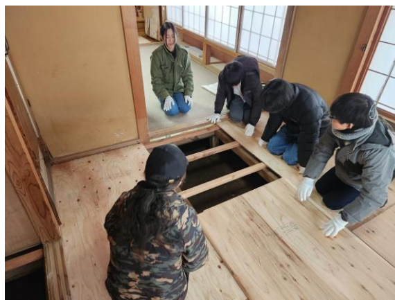
▲個別対応で行っている床板張りの作業