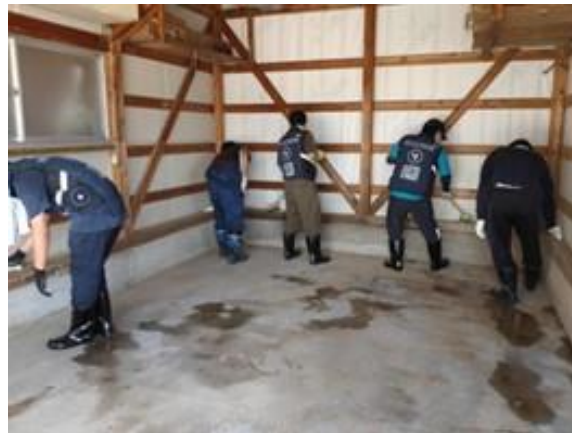
▲岩手大・岩手県立大・立教大・埼玉県立大合同チームでの活動（五城目町）