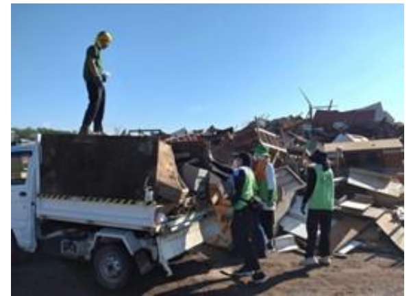
▲家財搬出、災害ゴミ置き場までの運搬作業（五城目町）