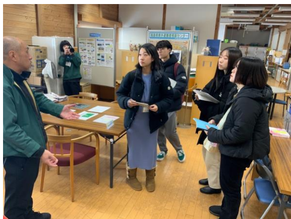
▲秋田県内のNPO団体への視察・情報交換

調理や食事を通じて参加者同士で交流しつつ、話の中では年明け以降の連携やコラボ企画の話も上がり、今後のネットワークづくりにつながるような信頼関係が生まれる機会となりました。