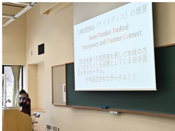
▲学生団体同士による活動事例紹介