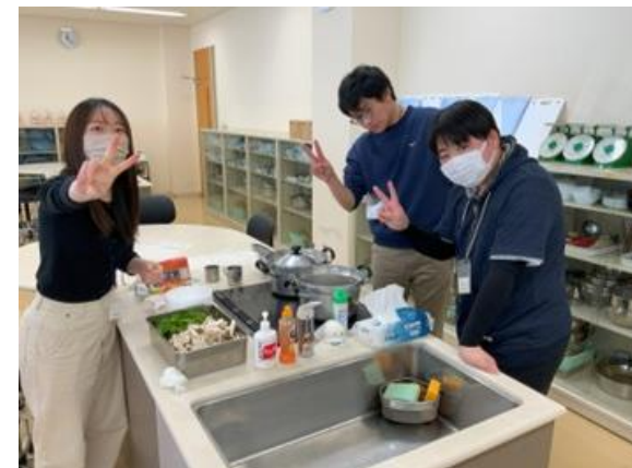
▲防災キャンプを通じた学生間の交流