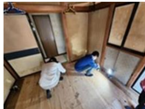
▲越冬に備えた床板貼り活動（秋田市）