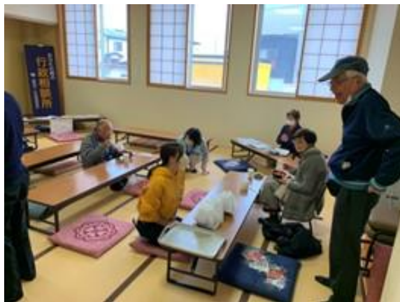
▲まるっと食堂での傾聴活動、炊き出し活動（秋田市）