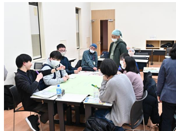
▲今後のネットワークの在り方について考える ワークショップ