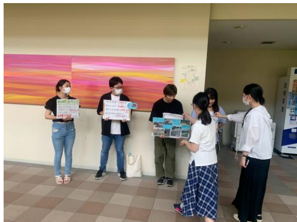
▲風土熱人R (岩手県立大学) による 募金活動 (7/25)

その後、「岩手県立大学学生ボランティアセンター (岩手県立大学)」、「学友会ボランティア委員会 結-You-」がボランティア活動先の川前自治会に募金活動について相談し、2団体合同で募金活動を実施しました。