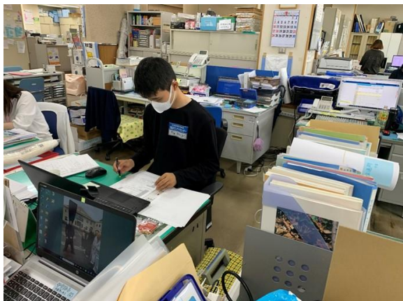
▲災害VCのボランティアニーズ票のデータ入力作業（秋田市）

※1：「秋田まるっと会議」は今回の災害で被災された方々の支援に向け、行政、社協、NPOが連携し、被災者の生活面・健康面でのサポート、コミュニティ支援、支援団体への情報・支援ノウハウの提供等をするためのプラットフォームです。