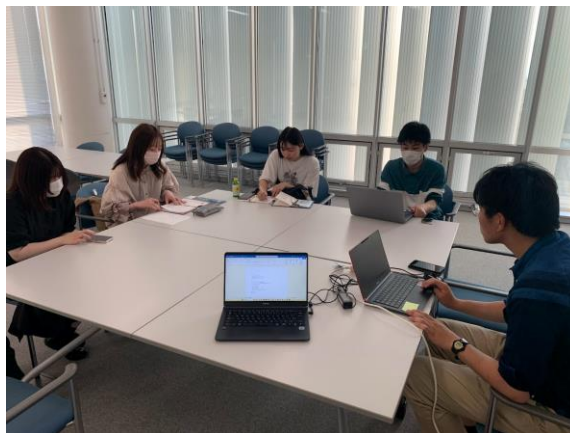
▲いわて学生ボランティアネットワーク 連絡会 (8/13)